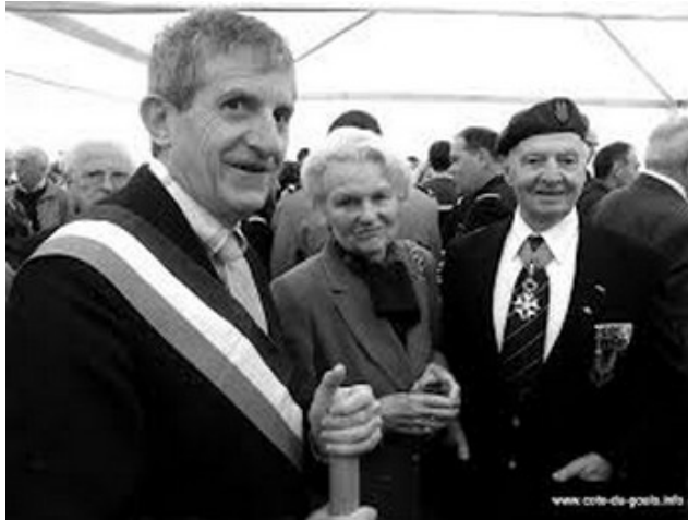
Edgar Thomé (Colonel)

Le colonel Edgar Thomé, un des quatre derniers Compagnons de la Libération encore vivants, vient d'être élevé à la dignité de Grand Croix de la Légion d'Honneur .