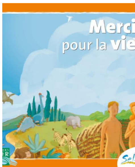
Merci pour la vie